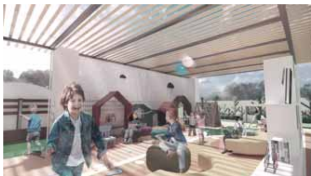
图3 公共区域效果图

互动性是体验式的具体表现形式之一,原始的互动性是人与物的互动,而如今的互动性体现在空间与人的互动,物与物的互动,人与物的互动,是一种全方位的互动体验。互动讲求的是相互而非单方面,尊重儿童需求,以儿童的视角出发,针对周围环境的软装饰。可以儿童自身的动手能力为出发点,局部空间塑造以引发儿童主动参与、自主设计意识激发为目的,采用总体空间的统一,局部空间的创意。如公共区域墙面的设置为可移动、可拼接形式,激发儿童在使用时的创意性(如图3所示)。