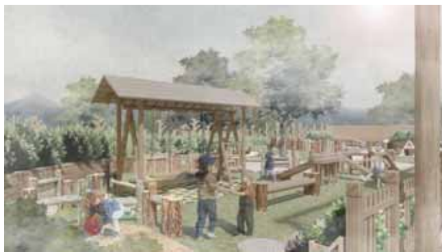
图4 活动区域效果图

的合理性决定儿童在活动过程中的体验感和安全感,将对儿童吸引力较强的元素、事物植入其中,形成完整的链性形式,达到一种可循环的有机空间形式。儿童对世界的认知从体块开始,无数体块构建起完整的空间认知,活动空间中异形体块的创建有机的串联了空间与儿童之间的联系(如图4所示)。