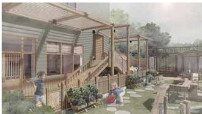
图2 公共空间效果图

语言能力和独立思考问题的能力。空间以体验式为依托运用延续性的方式设计,以儿童为中心,打造具备启发性、引导性的与大自然自然接触的公共空间,让儿童能在其中自由穿行,放松游戏、自由探索无序塑造的空间。内部的过渡空间在符合基本功能性的基础之上,加入儿童可走进的体验空间,使儿童的体验感与好奇心在一定程度上得到了满足,从空间角度来看使空间更加完整连贯,具有延续性。(如图2所示)。