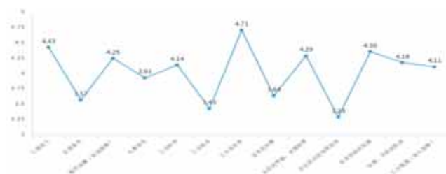
图1 职业环境期待因素重要性排名

物质需求作为基本的生存需求, 是职业环境中必不可少的一项。调查显示, Z世代城镇劳动者群体对物质条件的追求虽占有很大比重, 但已经不是唯一(见图1)。在满分为5分的“Z世代城镇劳动者职业环境期待因素重要性排名”中, 工作安全性以4.71的高分排名第一; 工资收入排第二, 为4.43分; 自身的职业技能紧随其后, 为4.36分。福利保障、工作时间、伙食状况、住宿条件、工作地点只排在第5、7、9、11、12名, 可见对物质需求的重要性正在下降。